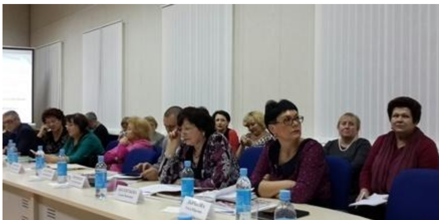
Участники круглого стола «Возможности культуры в образовании XXI века: проблемы, поиски, перспективы»