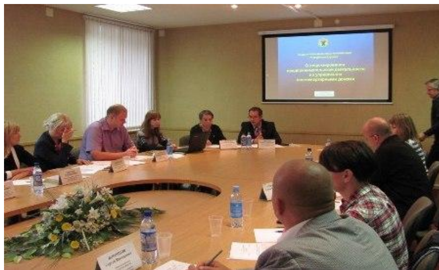
Расширенное заседание Комиссии

В ходе визита в Карелию в сентябре 2014 года секретаря Общественной палаты Российской Федерации А.В. Бречалова, членами Комиссии были организованы встречи с совершенно разными людьми, которых объединяет активная гражданская позиция и стремление заниматься общественной деятельностью, в ходе которых гость из Москвы смог узнать, чем занимаются общественники Карелии, что им уже удалось достичь.