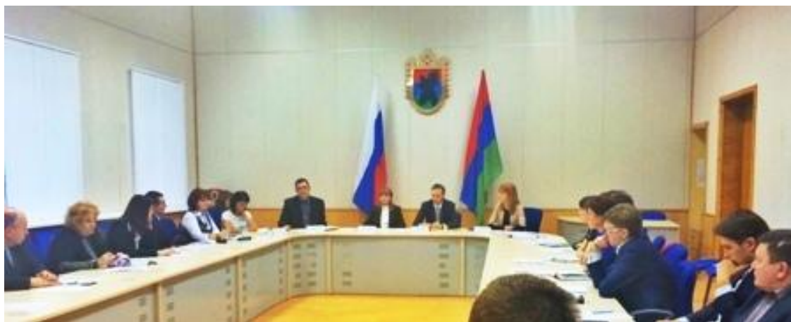
Участники круглого стола

При подготовке круглого стола проводился опрос администраций муниципальных районов и городских округов Республики Карелия на предмет выявления наиболее острых проблем реализации инвестиционной политики на местном уровне. Это позволило определить ключевые направления взаимодействия органов республиканской власти и местного самоуправления в повышении инвестиционной привлекательности республики. Участниками круглого стола было принято решение о проведении серии круглых столов по данной проблематике.